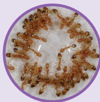
FOURMIS PHARAON Monomorium pharaonis