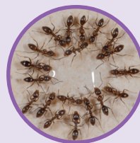
FOURMIS D'ARGENTINE Linepithema humile