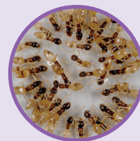
FOURMIS FANTÔME Tapinoma melanocephalum