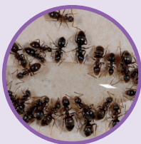
FOURMIS DES JARDINS Lasius niger